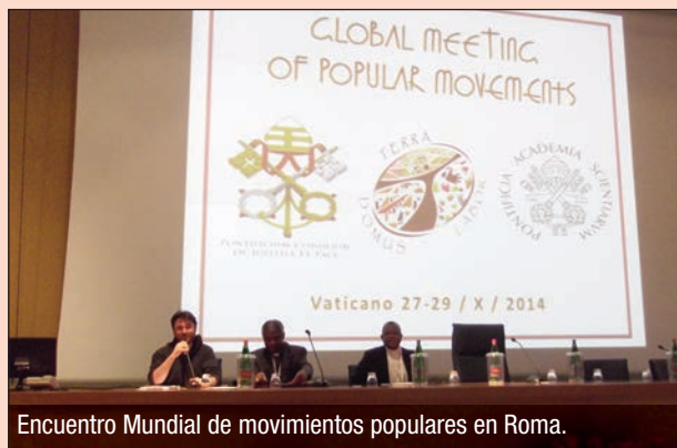
Encuentro Mundial de movimientos populares en Roma.

El encuentro ha sido muy enriquecedor por cuanto ha permitido compartir análisis y propuestas con muchas otras organizaciones de países donde tenemos entidades afiliadas, nos ha servido para identificarnos todavía más con quienes sienten que la dignidad del trabajo se está vulnerando en el mundo, indepen-