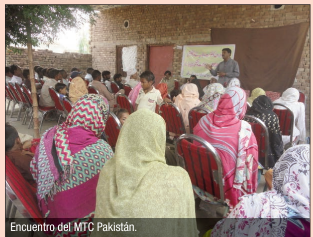
Encuentro del MTC Pakistán.

El MTC Pakistán ha organizado varios seminarios para concienciar a los trabajadores sobre diferentes temas relacionados con los trabajadores de los hornos de ladrillo como: los salarios notificados por el Gobierno, las tarjetas