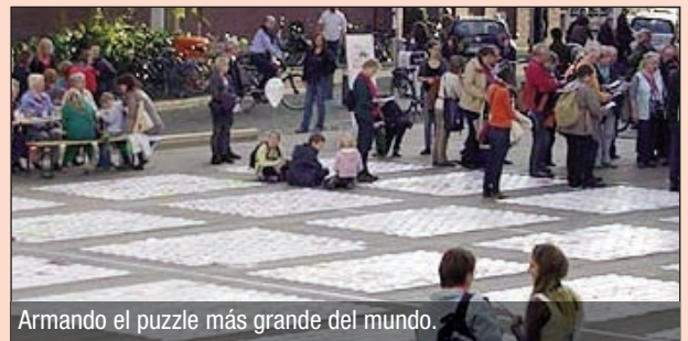
Armando el puzzle más grande del mundo.

Con la propuesta principal: «Reparto justo en lugar de división social. Vida y trabajo sostenibles» (Fair teilen statt sozial spalten – nachhaltig leben und arbeiten), que los delegados del Bundesverbandstag establecieron en Wurzburg en 2011, se dio comienzo al debate sobre la