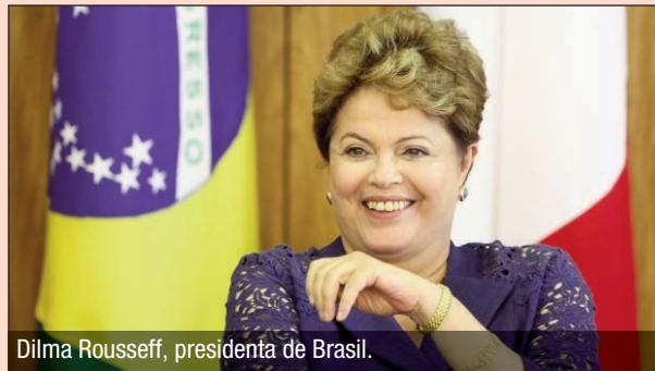
Dilma Rousseff, presidenta de Brasil.

«Hoy creo que fue por eso por lo que me llevaron el 18 de mayo de 1970 a Minas Gerais, concretamente a Juiz de Fora, alegando que yo tenía que declarar en el proceso que