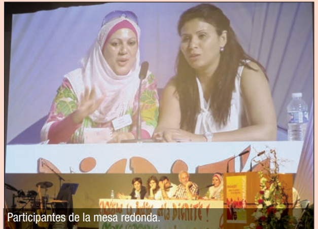
Participantes de la mesa redonda.

Desde el principio de la huelga, la ACO de Burdeos ha dirigido un mensaje de apoyo y solidaridad a los huelguistas. Por otra parte la ACO prevé invitar a los asalariados de esta clínica a un encuentro para compartir acerca de éste evento.