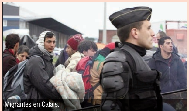
Migrantes en Calais.

El escándalo no radica básicamente en la demolición de estos campamentos improvisados sino en las razones por las que aparecieron. ¿Hasta cuándo seguiremos observando en nuestras costas esta denegación de humanidad que una indiferencia solapada se esfuerza por ocultar? La vagancia de estos migrantes no parece molestar ni perturbar a nadie. Cada uno de ellos tiene un rostro, una historia de vida; cada uno de ellos clama su sufrimiento, huye por desesperación, teme a la persecución. No hay ser humano que deje su país, su familia, su cultura,