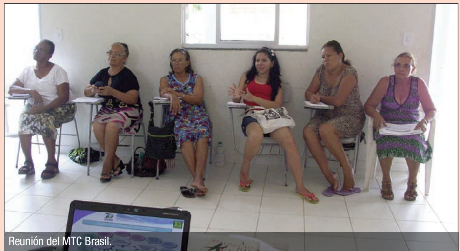
Reunión del MTC Brasil.

Por delante está el desafío de rearticular los movimientos cristianos de América del Sur. Lamentamos mu-