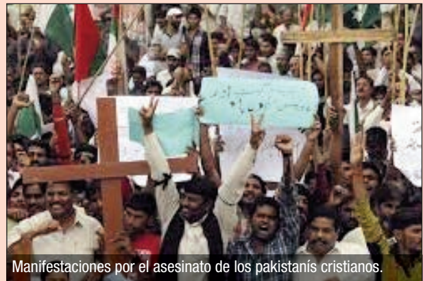
Manifestaciones por el asesinato de los pakistaníes cristianos.

Prosiguiendo la investigación sobre el incidente, la policía ha interrogado a más de 40 musulmanes pero hasta el momento no existe nin-