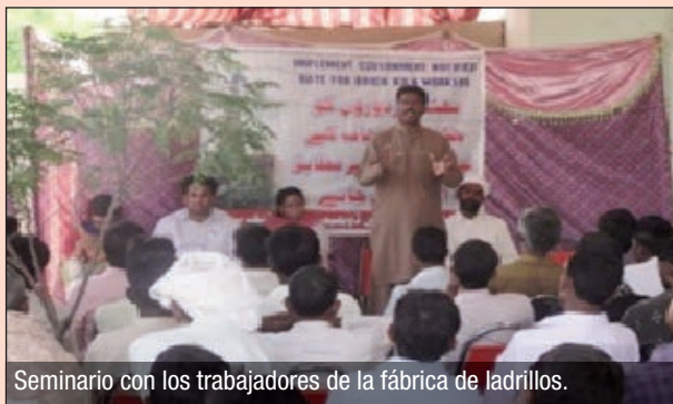
Seminario con los trabajadores de la fábrica de ladrillos.

de la seguridad social y la sindicalización.