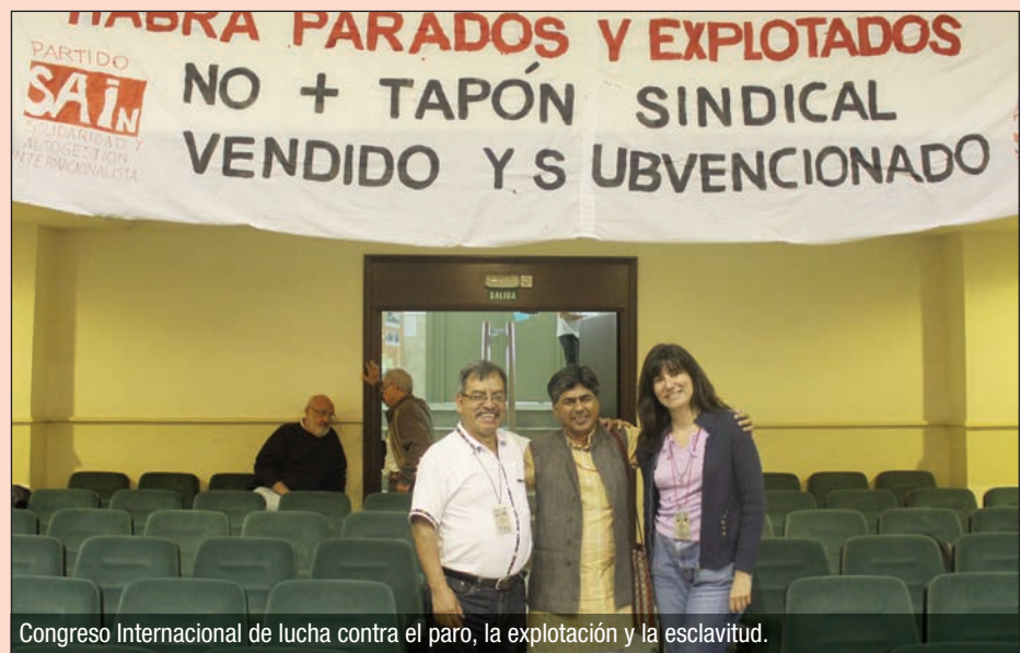
Congreso Internacional de lucha contra el paro, la explotación y la esclavitud.

dos días, se abordaron temas como: Paro y Explotación, Trabajo y Familia, Muros de la Vergüenza (análisis sobre políticas anti migrantes en Europa y Estados Unidos), Multinationales y explotación, Prostitución y