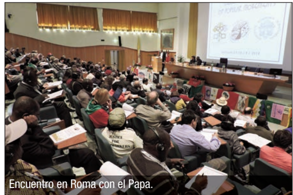
Encuentro en Roma con el Papa.

Soy recicladora en Colombia. Nuestro lema es que no haya fronteras para los que lu-