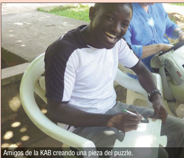
Amigos de la KAB creando una pieza del puzzle.

economía sostenible, que pone a las personas en el centro de atención. En casi todos los países del mundo, el beneficio y la explotación caracterizan a la economía y, con ello, al mundo laboral. Relaciones laborales precarias, migración mundial, salarios bajos y degradantes e inseguridad social son características de la vida de las trabajadoras y los trabajadores. La esperanza de que haya una estabilidad social sostenible solo se dará cuando todas las personas cambien su vida. El puzzle sobre el sentido de la vida de Duisburgo es expresión de esta solidaridad mundial. Personas de Asia, África, Latinoamérica y