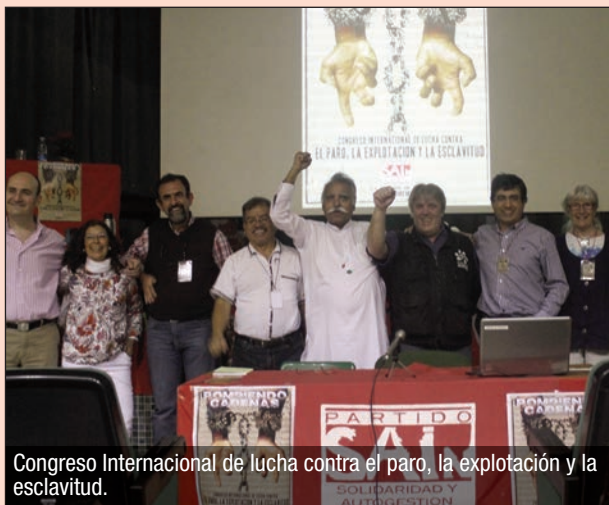
Congreso Internacional de lucha contra el paro, la explotación y la esclavitud.