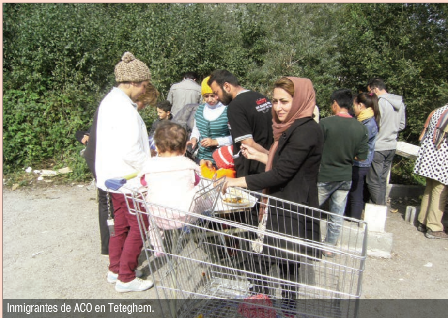
Inmigrantes de ACO en Teteghem.

No obstante, la población no queda indiferente ante esta miseria. Lejos de micros ni cámaras, la solidaridad se organiza en todas las ciudades de la costa (Calais, Steenvoorde, Lille Grande-Synthe, etc.).