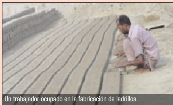
Un trabajador ocupado en la fabricación de ladrillos.