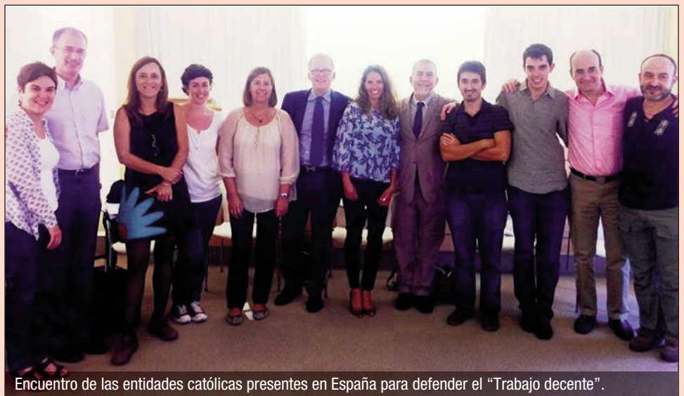
Encuentro de las entidades católicas presentes en España para defender el “Trabajo decente”.

En “Caritas in Veritate”, de Benedicto XVI, en el número 63, se define así el trabajo decente: “significa un trabajo que, en cualquier sociedad, sea expresión de la dignidad esencial de todo hombre o mujer: un trabajo libremente elegido, que asocie efectivamente a los trabajadores, hombres y mujeres, al desarrollo de su comunidad; un trabajo que, de este