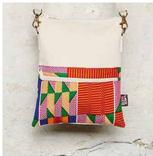
El Lloc de la Dona recibió la aportación solidaria de ACO del 2015. 1.000 € destinados a proyectos de apoyo a mujeres que ejercen la prostitución

Dona Kolors es la marca social de los productos artesanales que elaboran las mujeres que han recibido formación en costura en El Lloc de la Dona.