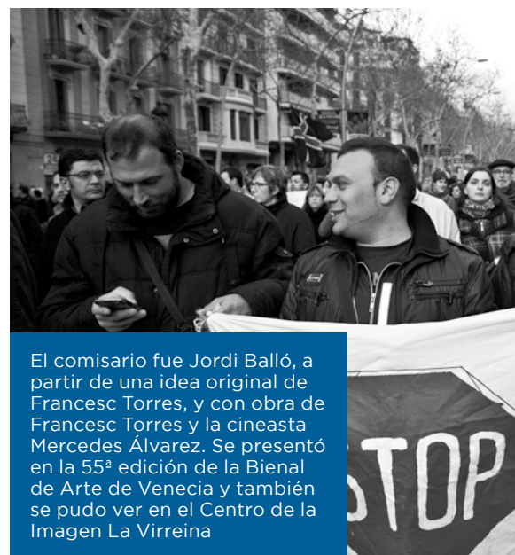
El comisario fue Jordi Balló, a partir de una idea original de Francesc Torres, y con obra de Francesc Torres y la cineasta Mercedes Álvarez. Se presentó en la 55ª edición de la Bienal de Arte de Venecia y también se pudo ver en el Centro de la Imagen La Virreina

El establecimiento de una renta básica universal sí que está en el debate público, en España y en muchos países occidentales. Según la Encuesta de Condiciones de Vida, que publica el Instituto Nacional de Estadística (INE), cerca del 30% de los españoles se encuentra en una situación de riesgo de pobreza y exclusión social. Esto quiere decir, para una familia con dos hijos pequeños, tener unos ingresos anuales por debajo de 17.000 euros. Los últimos datos disponibles comparables de las diferentes comunidades autónomas en relación a los diferentes sistemas de renta mínima de 2014, indican que solamente el 1,3% de los ciudadanos tienen una. Es decir, solamente unas 600.000 personas, que forman unos 265.000 hogares, con una percepción media de 420 euros mensuales en ayudas. La aplicación de estos subsidios es muy desigual. Mientras que en Andalucía llega a siete de cada mil habitantes, en Euskadi y Navarra superan los 50. En Catalunya la cifra es 9,1. La